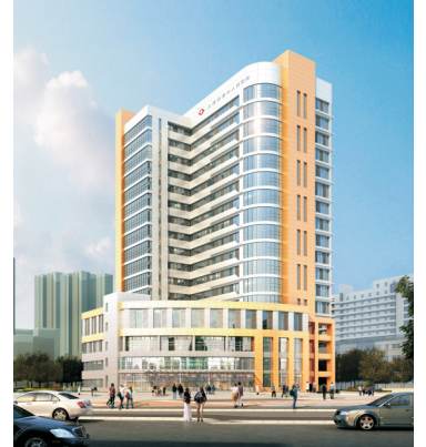
上海市第六人民医院 能效测评