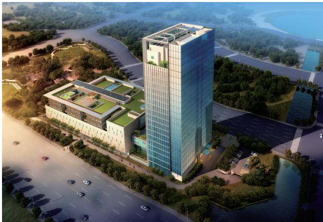
苏州工业园区设计研究院新办公大楼 绿色建筑运行标识检测