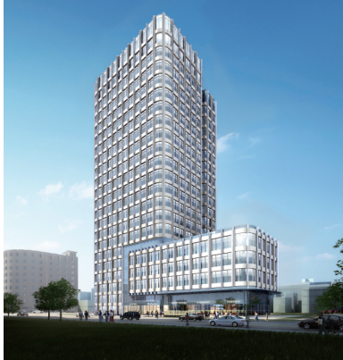
国泰君安新建办公楼 通风空调、能效测评