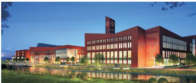
上海德国英国国际学校 外墙饰面砖粘结质量检测与评估