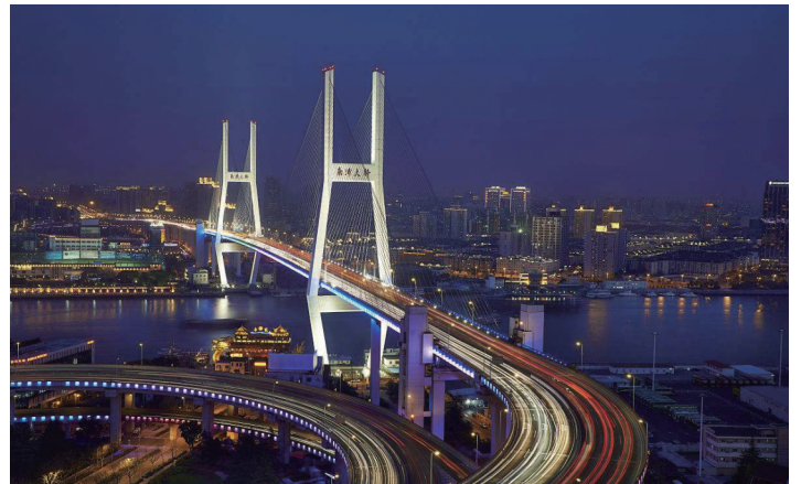
南浦大桥 景观照明质量检测与评估