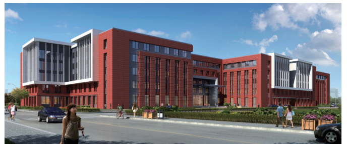
上海交通大学新建闵行校区转化医学大楼 通风空调、照明、能效测评