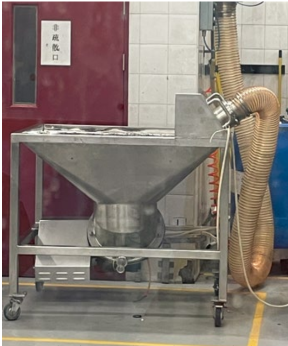
日化粉末车间投料岗位防护装置