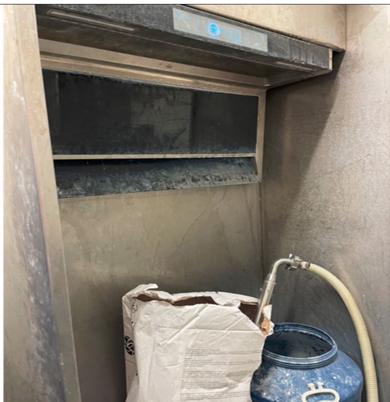
日化粉末车间二氧化硅粉料投料现场