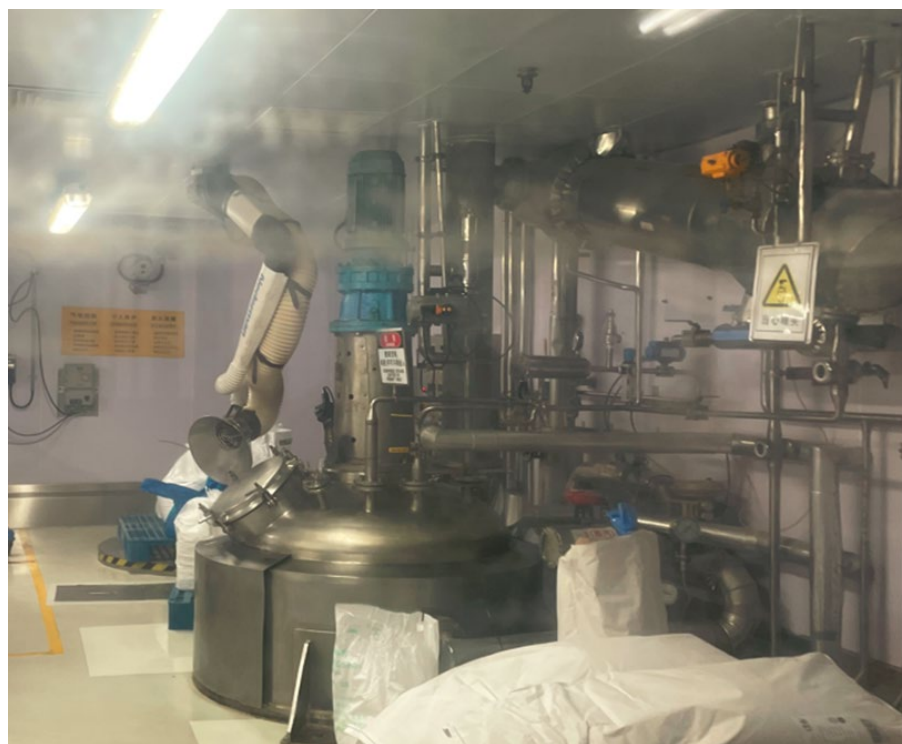
混合罐投料岗位防护装置