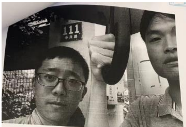
现场调查、现场 采样、现场检测 图像影像