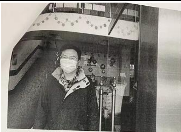
现场调查、现场 采样、现场检测 图像影像