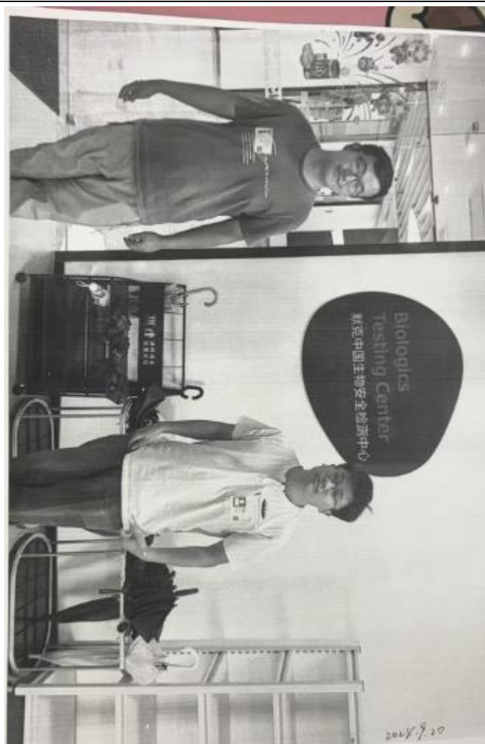
现场调查、现场 采样、现场检测 图像影像