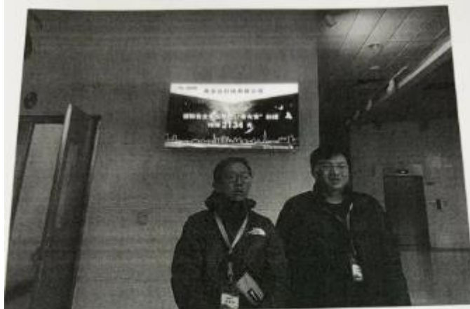
现场调查、现场 采样、现场检测 图像影像