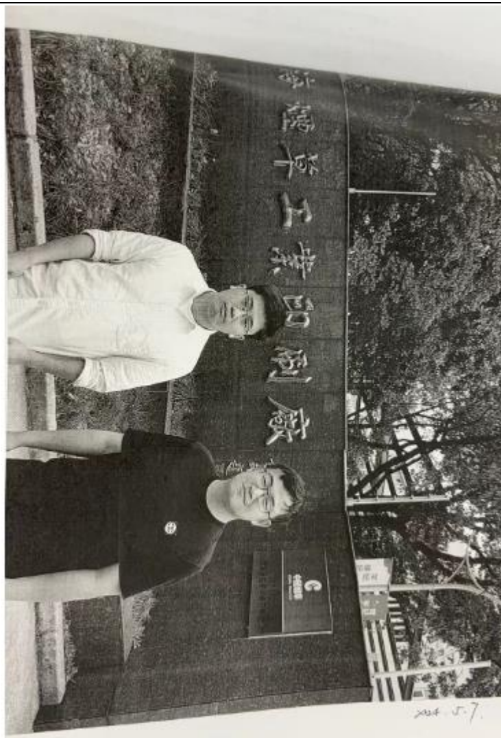
现场调查、现场 采样、现场检测 图像影像